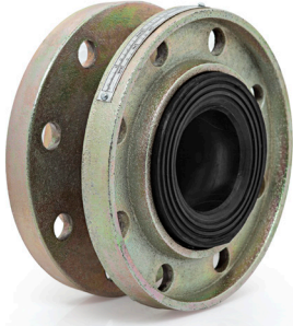
UKK-30 FLANŞLI KAUCUK KOMPANSATÖR